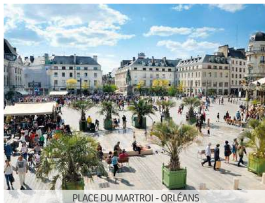
PLACE DU MARTROI - ORLÉANS