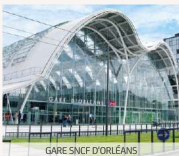
GARE SNCF D'ORLÉANS

Ce programme immobilier a pour priorité d'offrir à ses habitants une réelle qualité de vie. C'est dans un environnement verdoyant que vous pourrez profiter de votre logement dont la distribution des pièces est fonctionnelle et équilibrée. Conforme à la RT 2012, vous aurez la maîtrise de la consommation énergétique dans un cadre douillet et confortable.