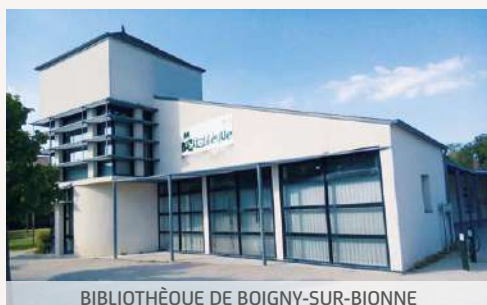
BIBLIOTHÈQUE DE BOIGNY-SUR-BIONNE

AU CŒUR D'UNE RÉGION DYNAMIQUE REMARQUABLE