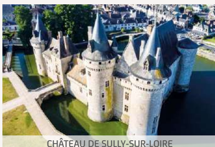
CHÂTEAU DE SULLY-SUR-LOIRE