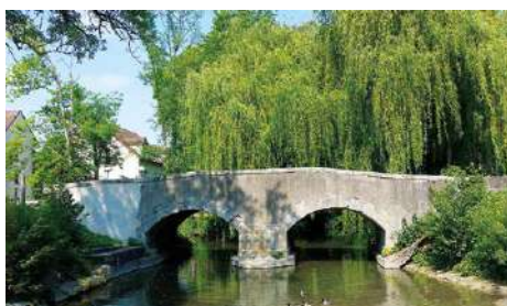
PONT SUR LA BIONNE