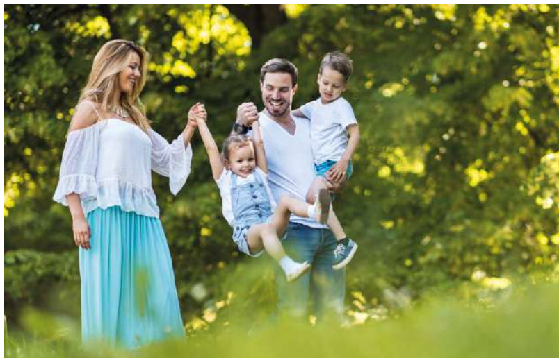
FORÊT DOMANIALE D'ORLÉANS